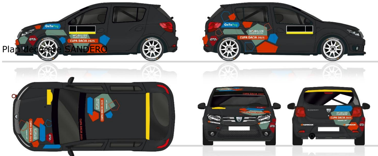
Plan de decorare SANDERO